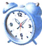
der Wecker 15,80 €