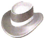
der Hut 32,90 €

5) Arbeiten Sie mit einem Partner. Fragen Sie abwechselnd nach den Preisen und antworten Sie.