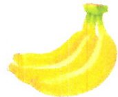
die Bananen 1,95 €