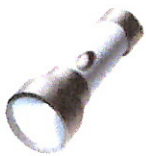
die Taschenlampe 5,98 €