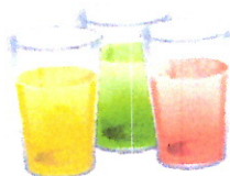
die Getränke 6,70 €