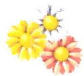
die Blumen 3,60 €